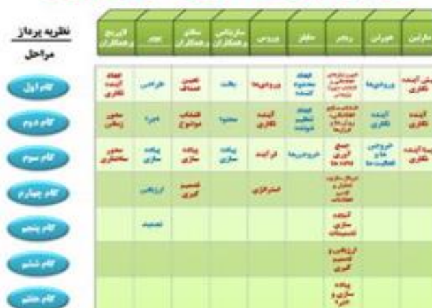
شکل ۱. مراحل و گام‌های آینده‌نگاری از دیدگاه صاحب‌نظران مختلف

امروزه ایجاد مناطق آزاد تجاری (Free Trade Zones) و ویژه اقتصادی (Special Economic Zones) با هدف تقویت تولید، توسعه صادرات، ایجاد اشتغال و جذب سرمایه در کشورها تأسیس می‌شوند. (Akinci & etc, 2008: 141) در ادبیات مناطق آزاد، منطقه آزاد