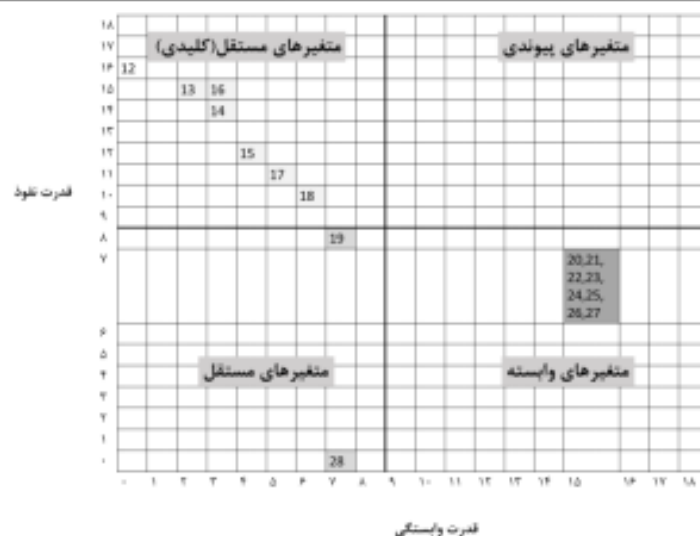
شکل ۴. خوشه‌بندی عوامل تأثیرگذار در مرحله آینده‌نگاری با استفاده از روش MICMAC (همان)